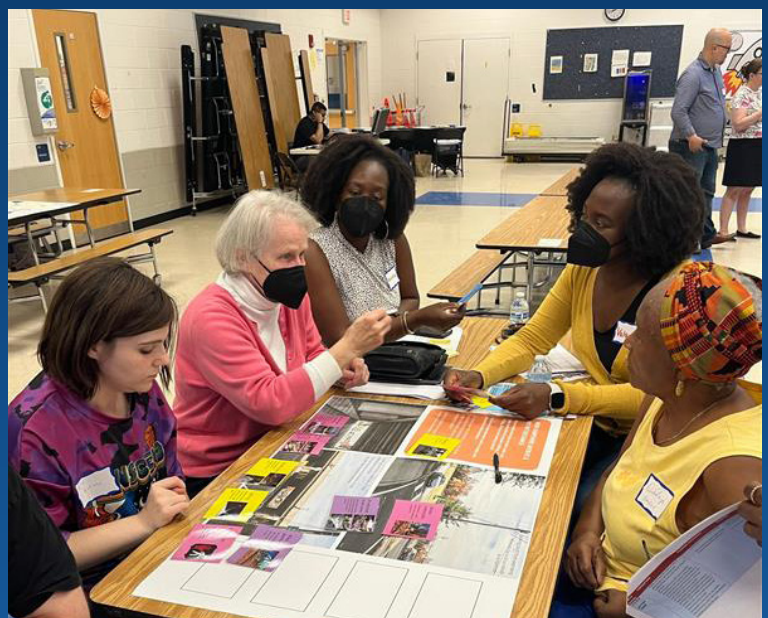
Conversación comunitaria sobre New Hampshire Avenue de abril de 2025