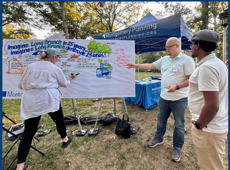
Long Branch Festival, septiembre de 2025

El personal de Planificación combinó esta aportación comunitaria con las políticas del condado y las mejores prácticas de planificación para desarrollar estas recomendaciones preliminares. Estas primeras ideas seguirán siendo moldeadas por los comentarios de la comunidad y de la Junta de Planificación e informarán el primer borrador del plan, previsto para el otoño de 2026.