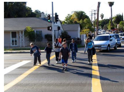
Cruces más seguros

En Visión Zero, disminuimos la frecuencia y la severidad de los accidentes reduciendo velocidades, designando espacios separados, creando cruces más seguros, y creando previsibilidad cuando usuarios de la carreteras cruzan caminos.